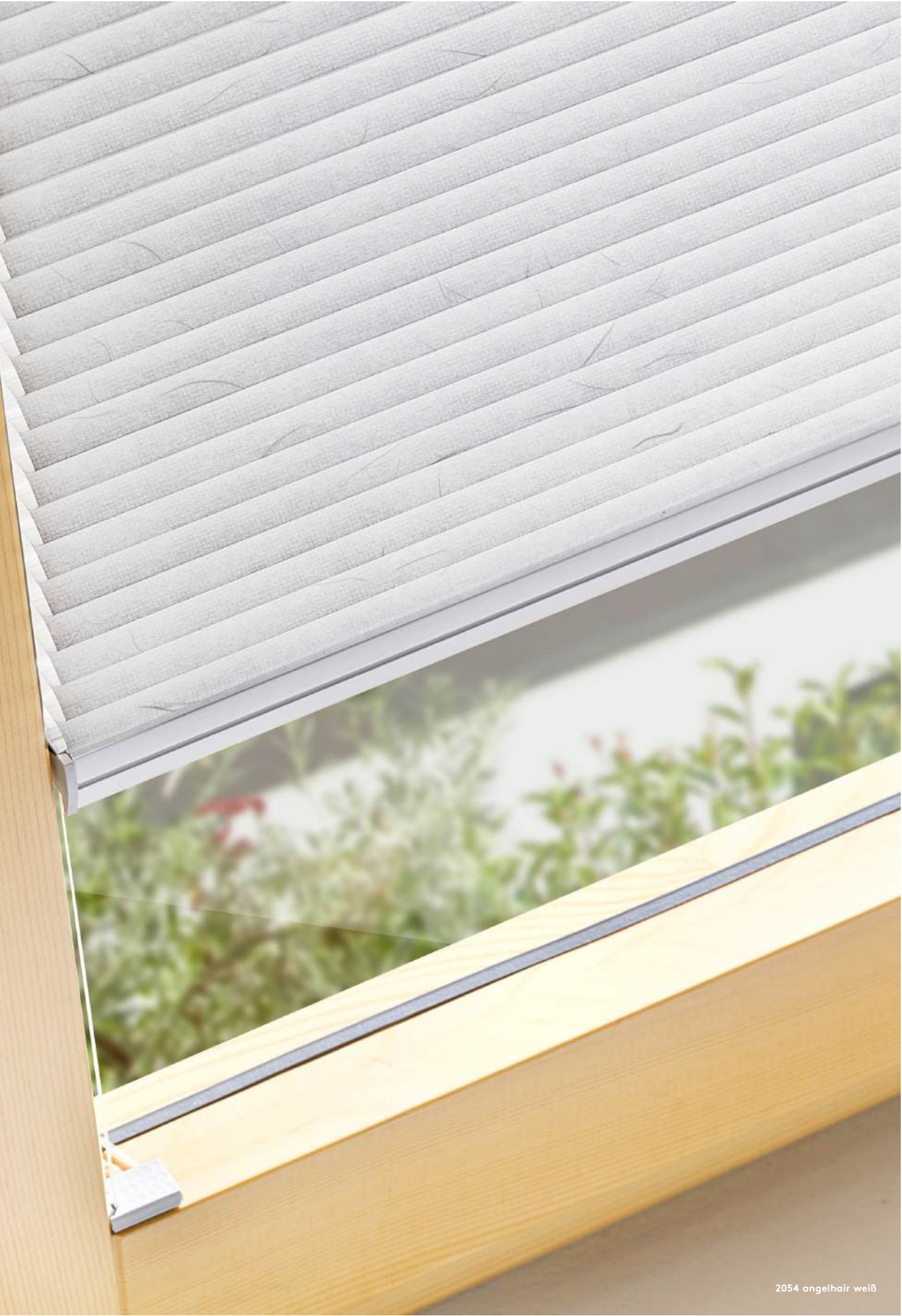
2054 angelhair weiß