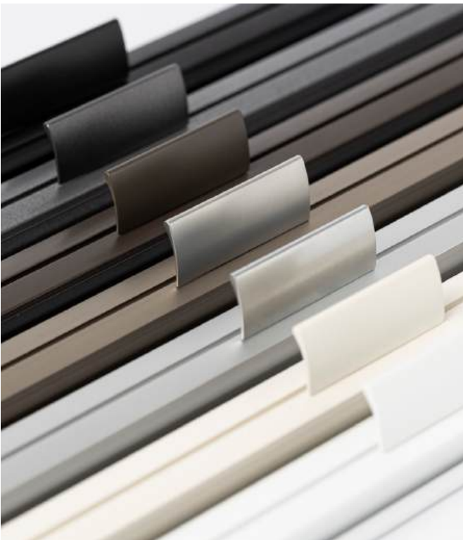
Metallgriff Fusion auf Wunsch

Der schicke Metallgriff passt hervorragend zu Oberfläche und Design der Bedienungsschienen. Wer einen klappbaren, transparenten Griff bevorzugt, kann diesen ohne Aufzahlung bestellen.