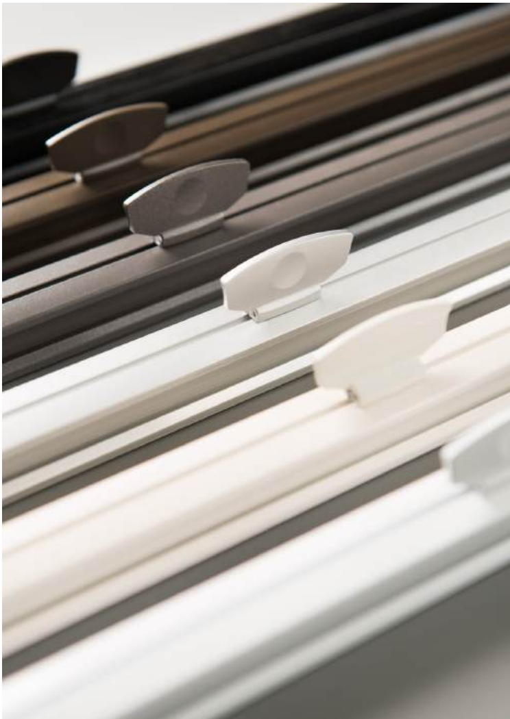
Metallgriff EOS Standard